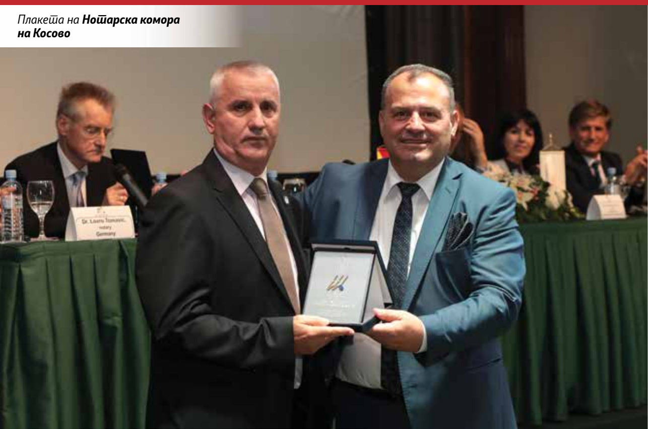
Плакеја на Ношарска комора на Косово