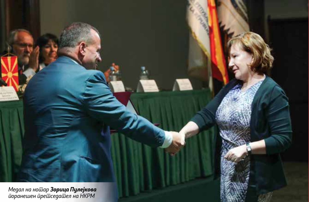
Медал на ноџар Зорица Пулејкова џоранешен џрејџседаџел на НКРМ