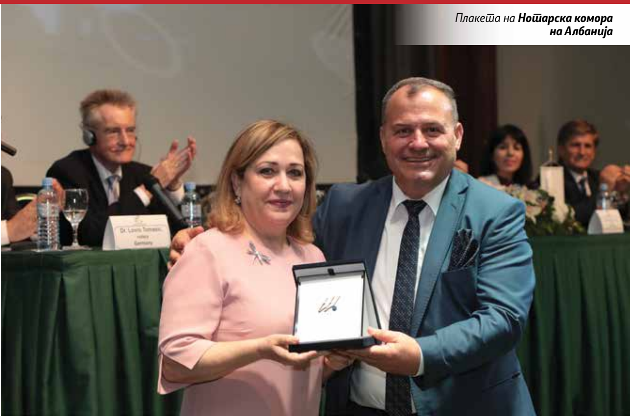
Плакеџа на Ноџарска комора на Албанија