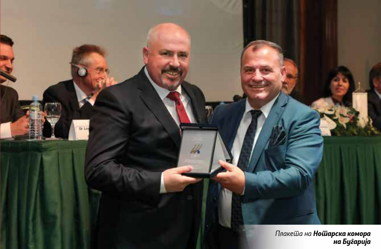
Плакеџа на Ноџарска комора на Буџарија