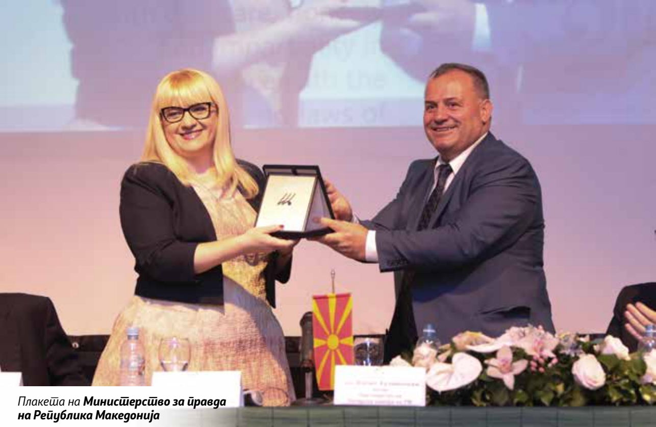
Плакеџа на Минисџерсџиво за џривада на Република Македонија