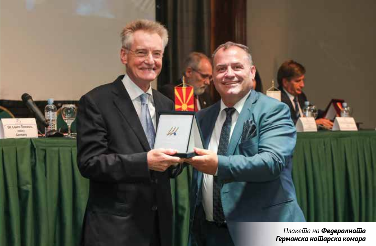
Плакета на Федералната Германска нојарска комора