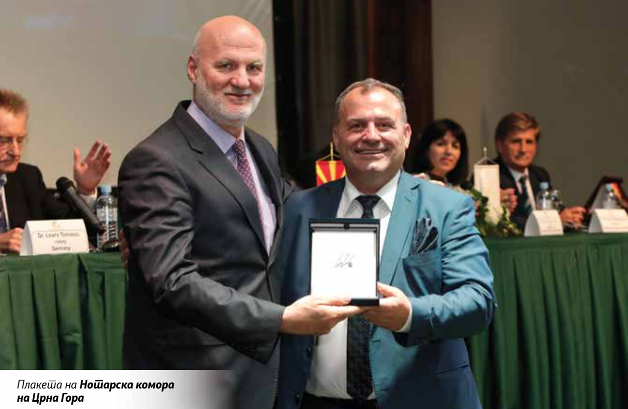
Плакеја на Ношарска комора на Црна Гора