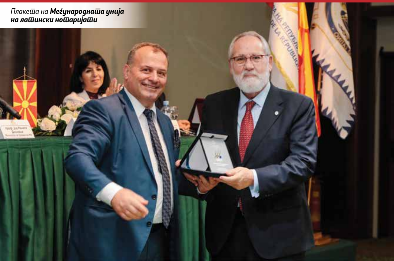
Плакеџа на Меџународнија унија на лажински ноџаријаџи