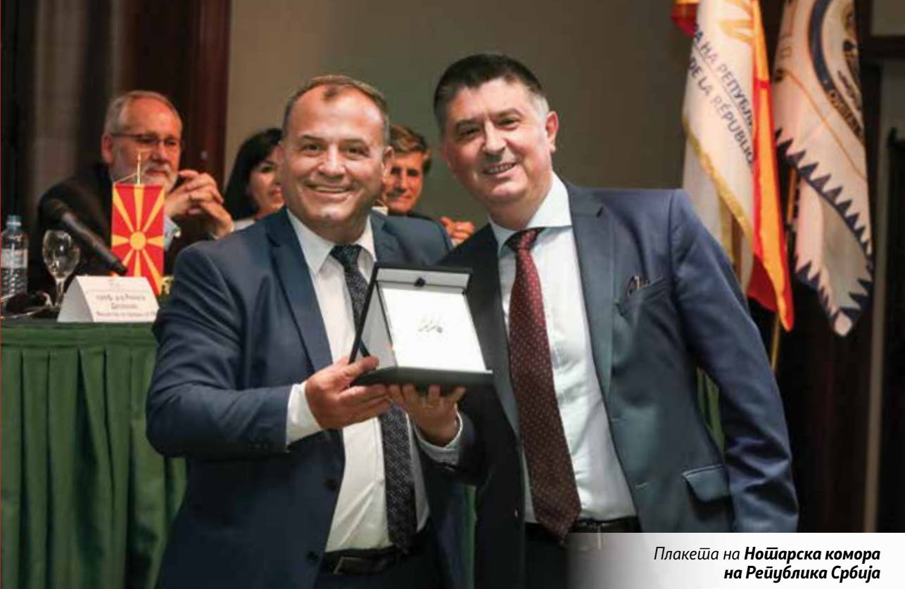
Плакета на Нојарска комора на Република Србија