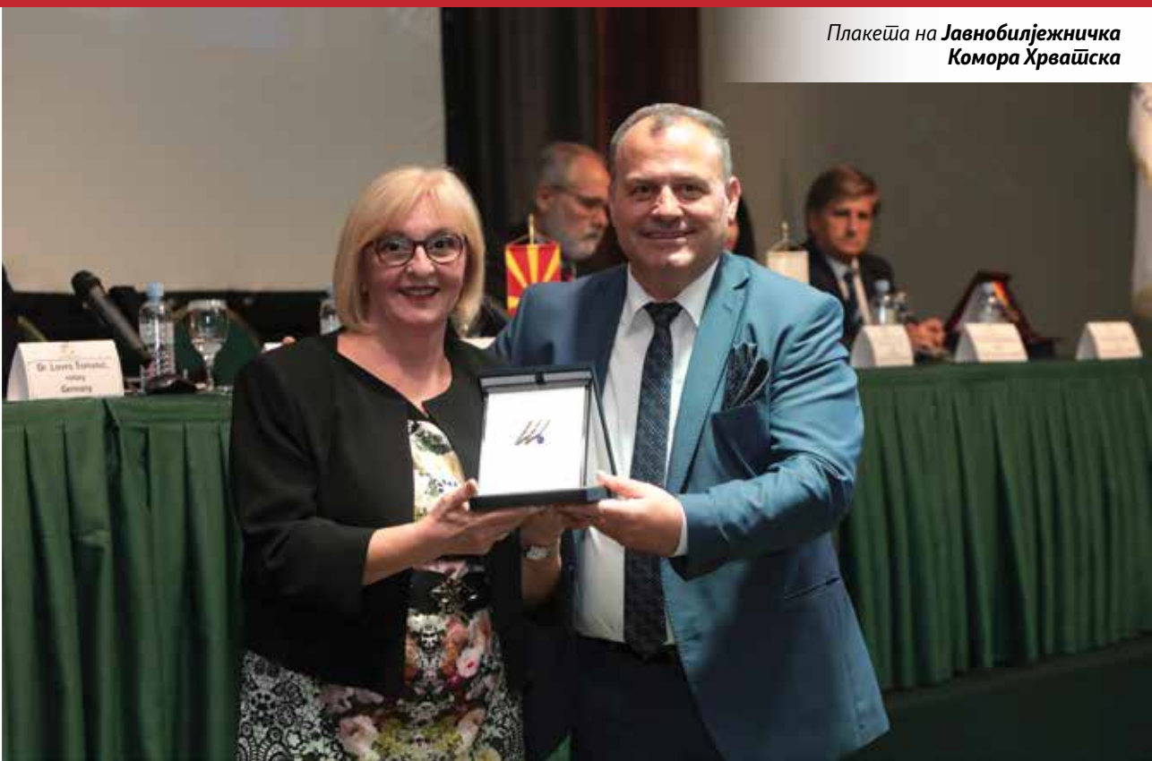
Плакета на Јавнобилежничка Комора Хрватска