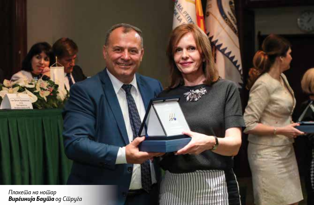
Плакеџа на ноџар Вирџинија Бауџа од Сџируџа