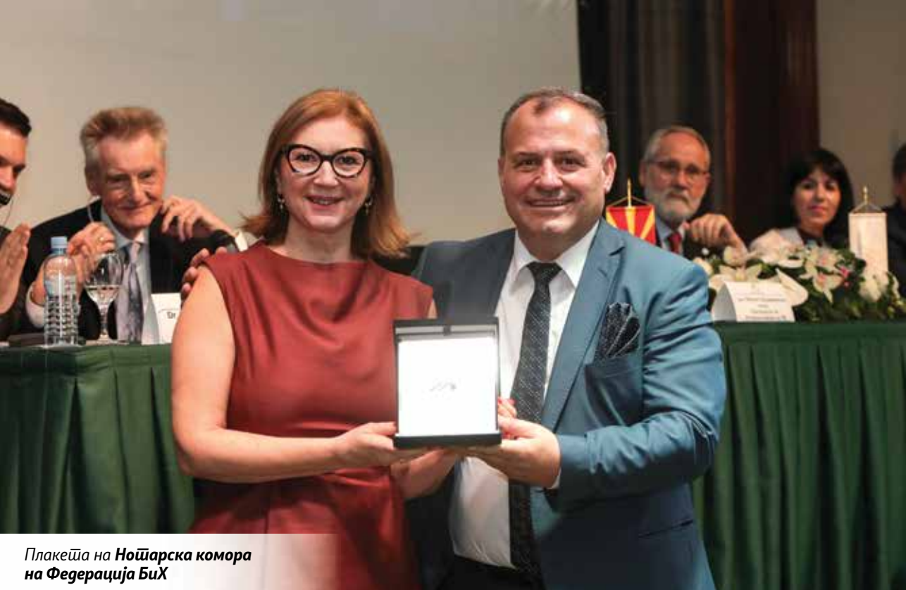
Плакеја на Ношарска комора на Федерација БиХ