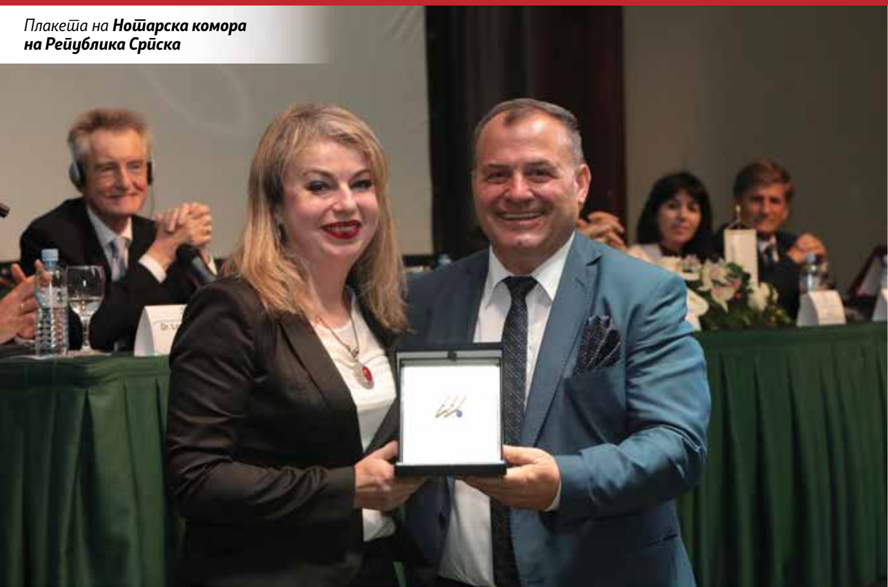
Плакеја на Ношарска комора на Република Српска